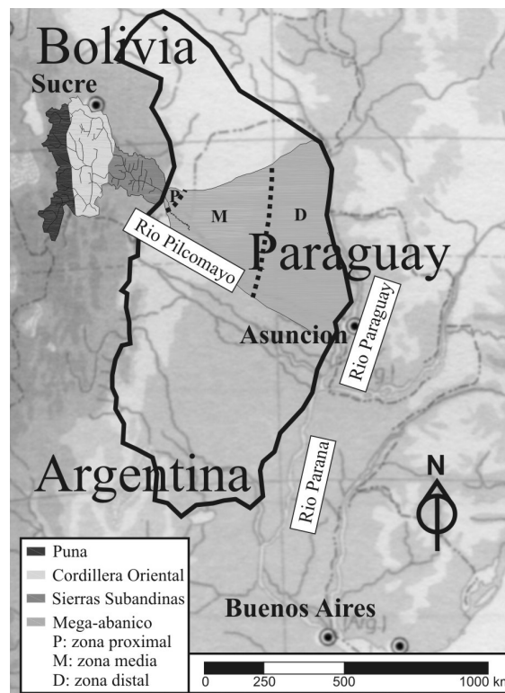
Figura 1.- Ambientes Geológicos del sistema del río Pilcomayo los Andes y el Chaco.

El Pilcomayo es uno de los ríos Chaqueños que mediante procesos de avulsión ha formado el mega-abanico activo más grande del mundo (Figura 1). En la superficie del mega-abanico se reconoce un diseño distributivo de antiguas fajas aluviales a diversas cotas que contienen distintas geoformas algunas de ellas similares a las de la faja actual.