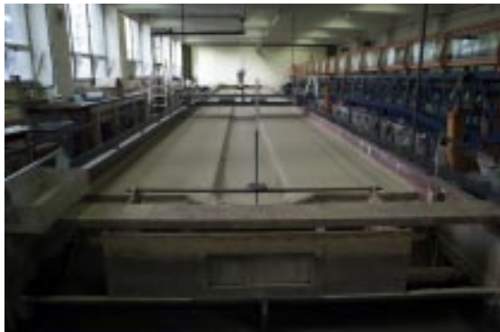
Figura 1.- Canal alisado, condición inicial de ensayo.

Una serie de ensayos preliminares se realizaron en el canal experimental del laboratorio de Hidráulica de la Universidad de Newcastle Upon Tyne, manteniendo una pendiente del lecho uniforme de 0.002m/m. El mismo está construido en madera, consta de 2.5m de ancho, 22.0m de largo y 0.6m de altura, y presenta lecho de arena de granulometría uniforme (1mm de diámetro), ver Figura 1. En el lecho de arena se excava la sección transversal prismática del cauce principal que se desea estudiar, usando dos rieles ajustables ubicados en los bordes superiores del canal y con los que es posible cambiar además la pendiente del lecho. En caso de querer realizar ensayos con aporte de sedimentos a la entrada del canal se cuenta con un alimentador de sedimentos, el cual puede funcionar con distintas tasas de transporte.