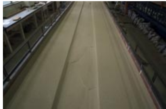
Figura 2.- Barras alternadas.

En todos los casos en el proceso de lograr el equilibrio se observó la formación de barras alternadas (Ver Figura 2 y 3), las cuales se mantuvieron migrando lentamente aguas abajo sin mostrar ninguna reacción a los cambios introducidos y sin causar ninguna acción aparente sobre las márgenes; las cuales a su vez mantuvieron una movilidad menor del 2% por hora.