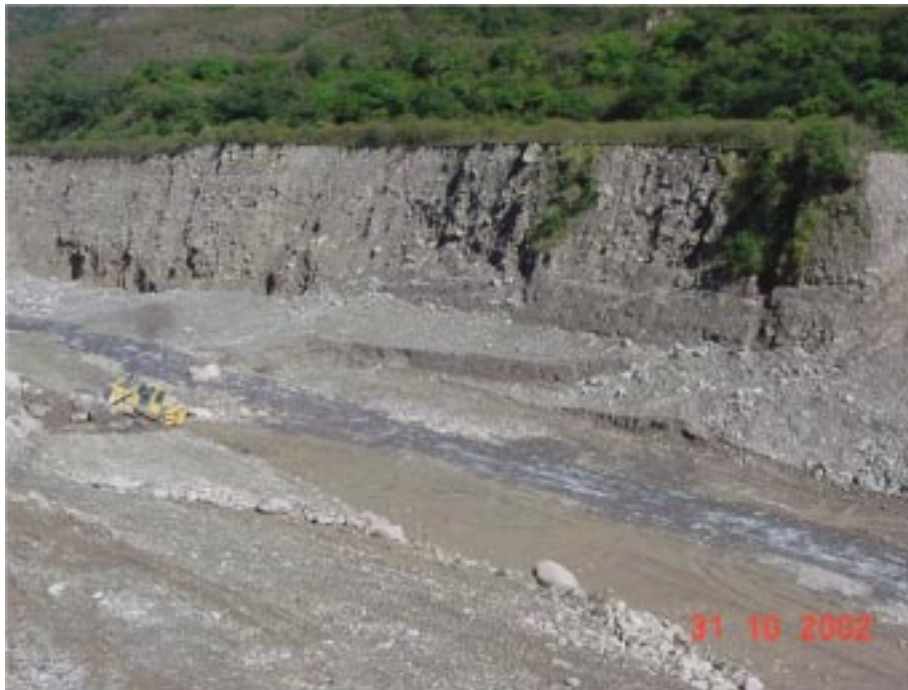
Figura 1.- Barranca de material granular de fuerte pendiente. Río San Andrés nivel aprox. 1800 msnm – Provincia de Salta.