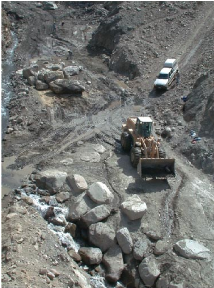
Figura 4.- Enrocado ciclópeo con junta tomada con suelo cemento