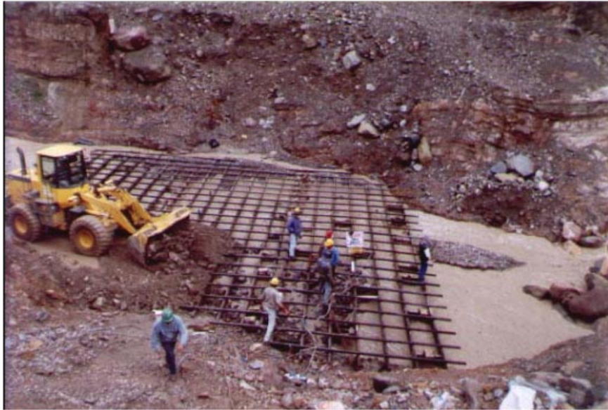
Figura 5.- Protección de lecho con reja de acero estructural